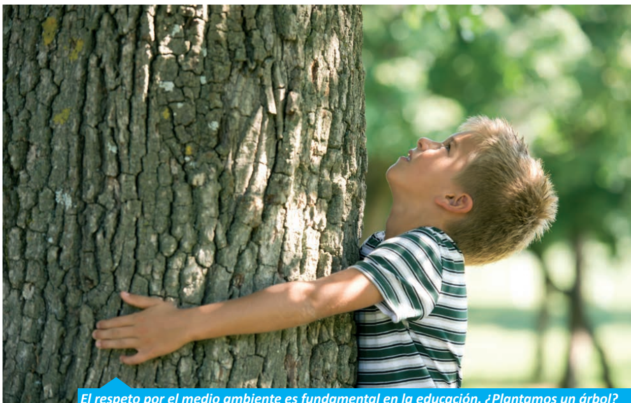
El respeto por el medio ambiente es fundamental en la educación. ¿Plantamos un árbol? supone informarnos también de su aspecto y de los cuidados que requiere.