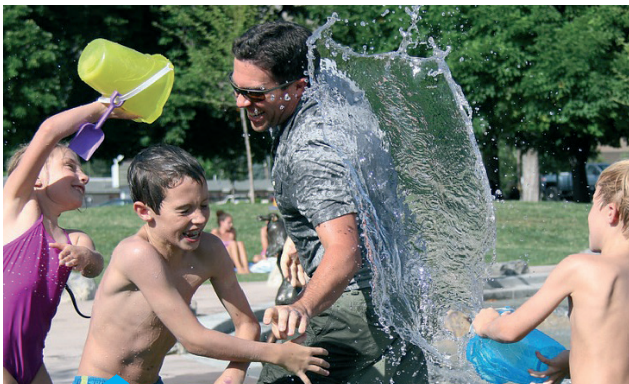
Las vacaciones son un tiempo de descanso ideal para pasarlo con la familia. ¿Pensamos a dónde ir, cuándo y cómo llegar?

diez). Seguro que a lo largo de un viaje uno o más miembros de la familia hayan realizado fotografías digitales. Agrupemos todas las fotografías en una misma carpeta. Organicemos el modo en el que nos gustaría presentarlas. Intentemos ponerles un fondo musical y mediante algún programa informático hagamos un montaje que realice la presentación de las mismas de forma automática.