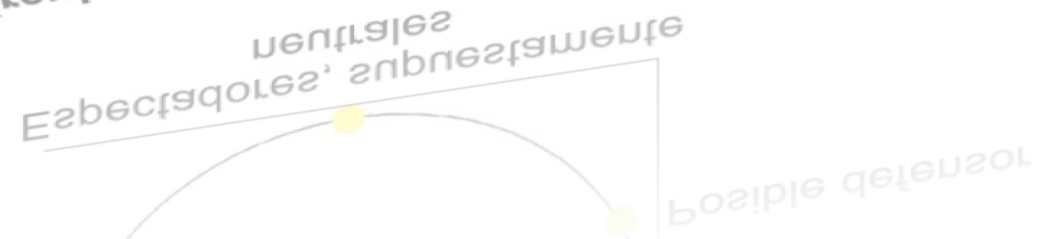
El círculo del bullying (Olweus, 2001)