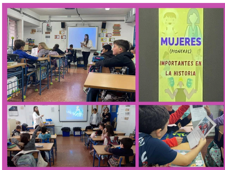
Taller "Mujeres importantes en la historia" del programa "Educando en Igualdad" 2023

El apoyo en la educación de nuestros hijos e hijas es uno de los valores fundamentales de esta asociación. Por eso, nuestra AMPA no solo se limita a aportaciones materiales, sino que también buscamos activamente nuevas formas de subvencionar y apoyar aspectos fundamentales como la igualdad de género, la prevención del bullying y la lucha contra las adicciones. Ayudados principalmente de subvenciones públicas que complementamos con las aportaciones de los socios, hemos llevado a cabo diferentes talleres dentro del cole adaptados a todos los niveles educativos desde infantil hasta 3º ciclo.